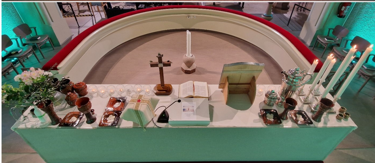
Altтари kuvattuna messun jälkeen molemmista suunnista